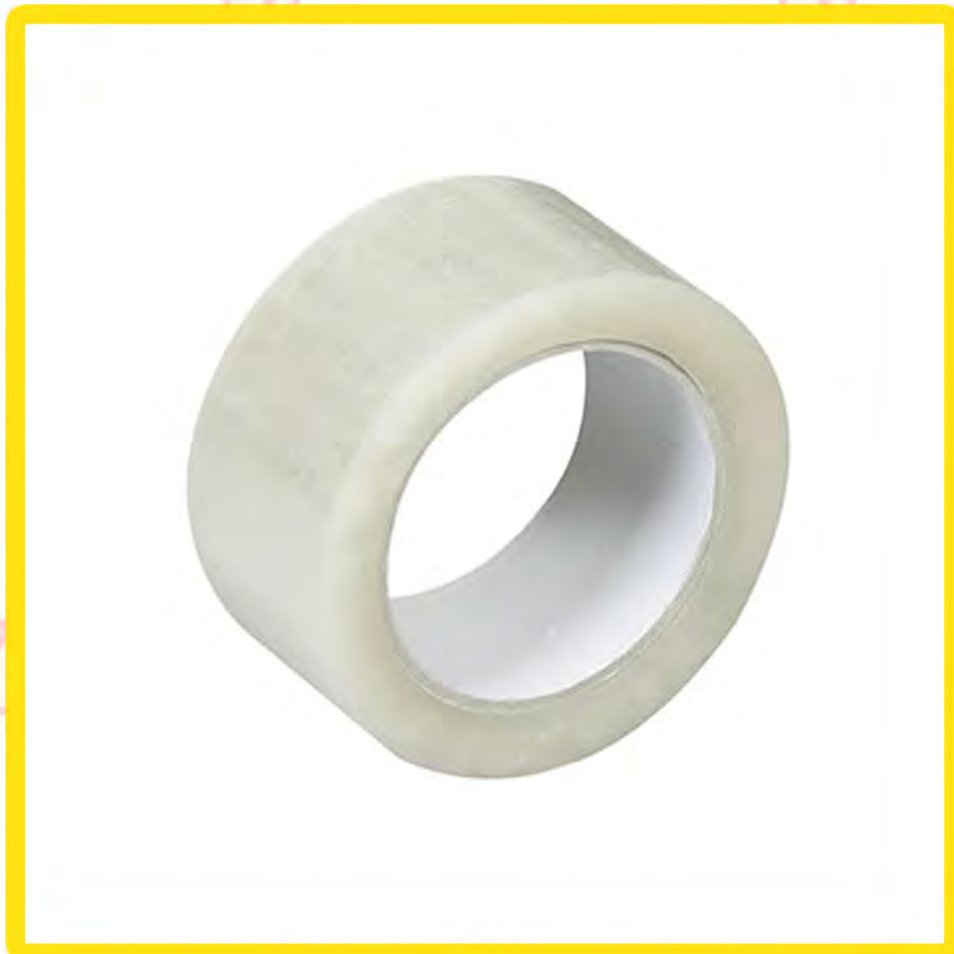
Провидна лепљива трака