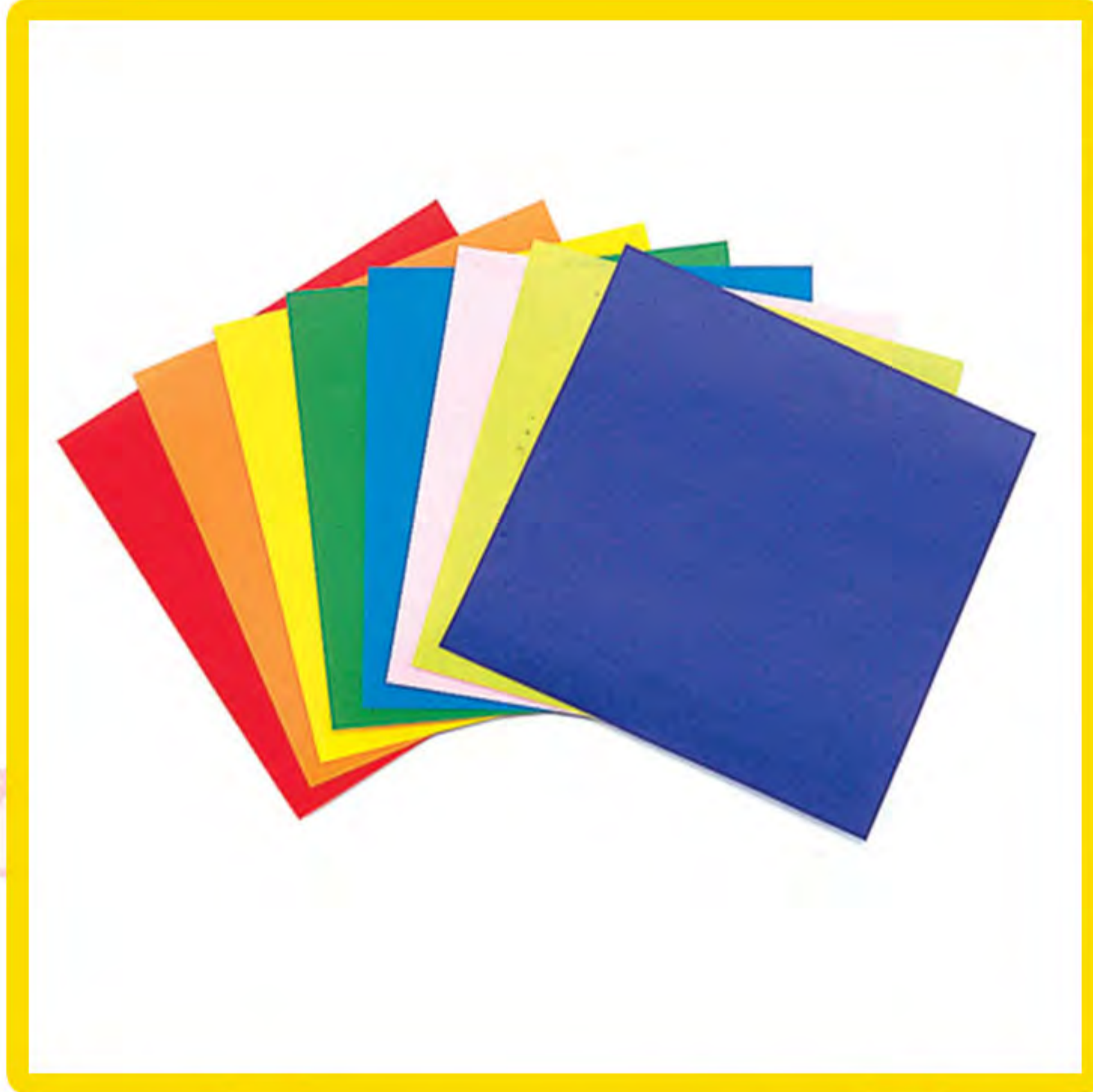
Папир у боји