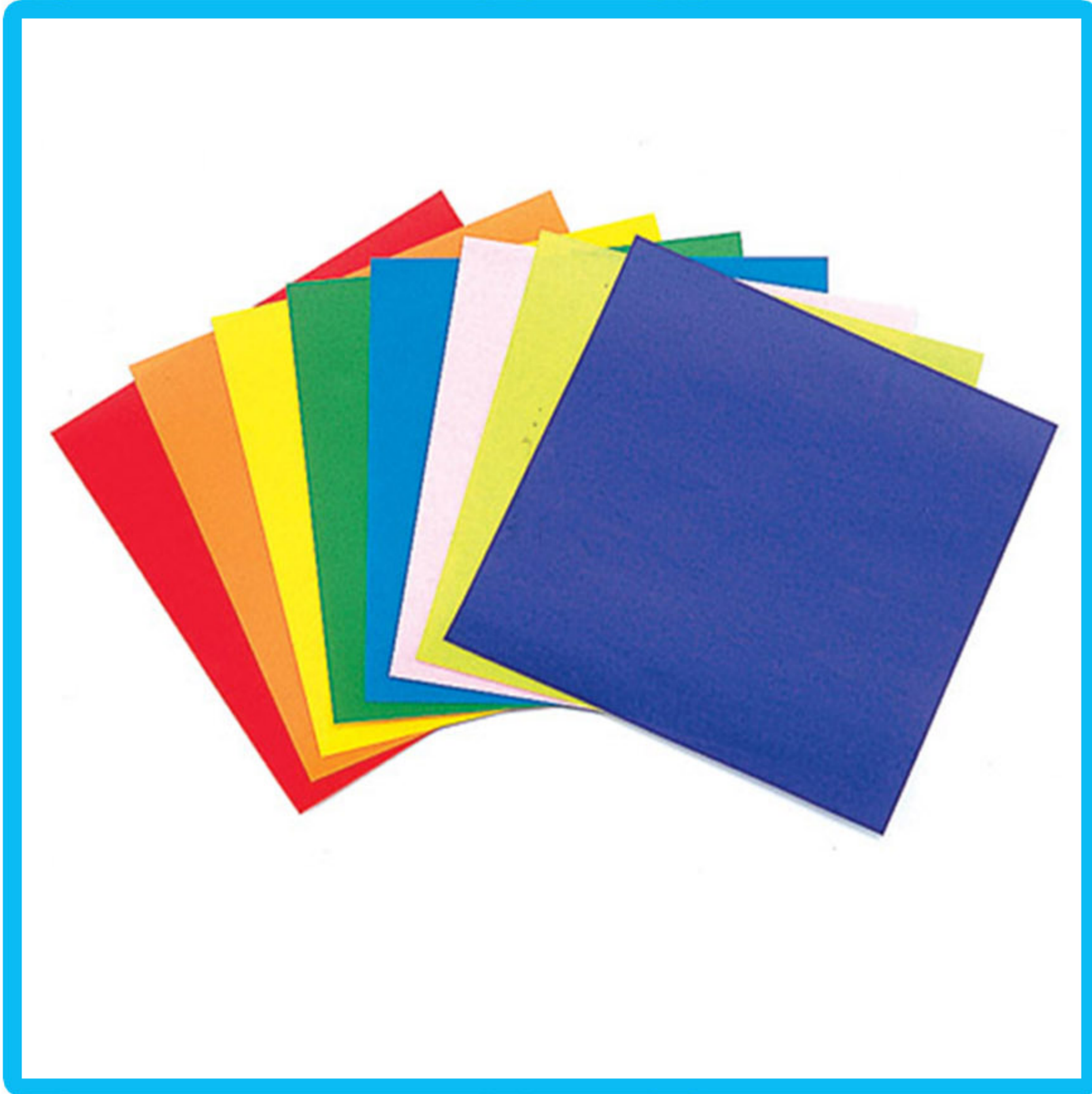
Папир у боји