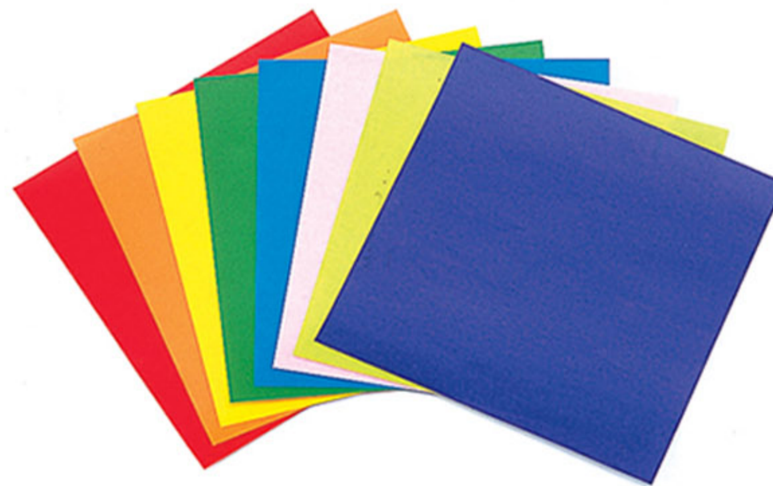
Папир у боји