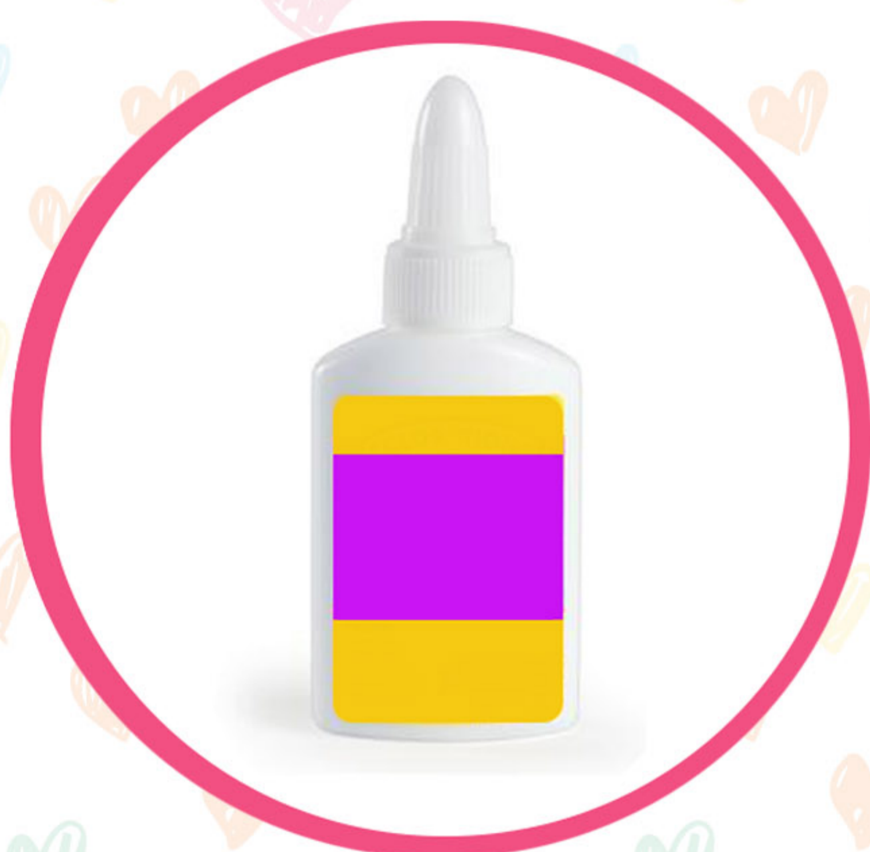
Лепак за филц