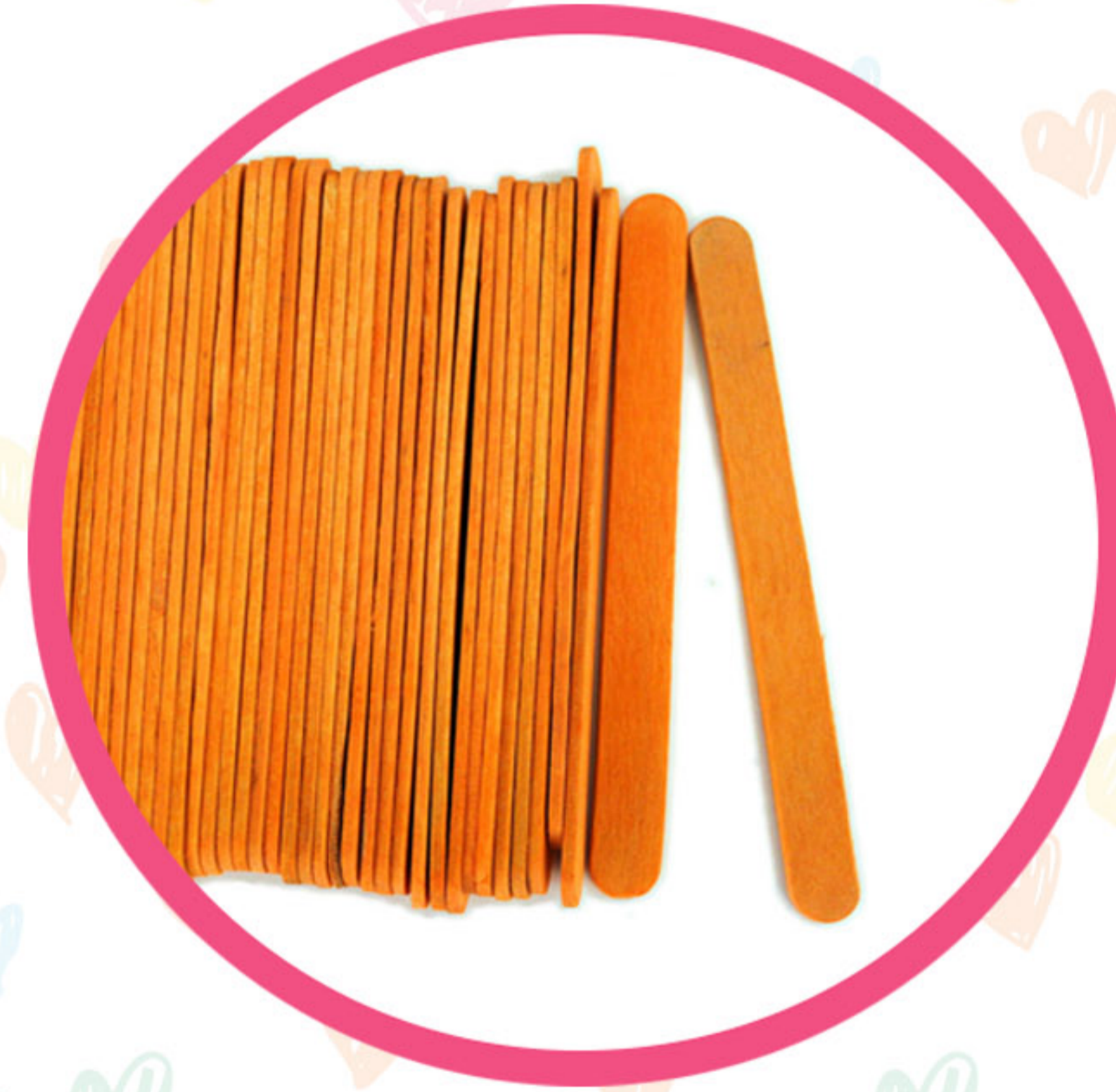
Штапићи за сладолед