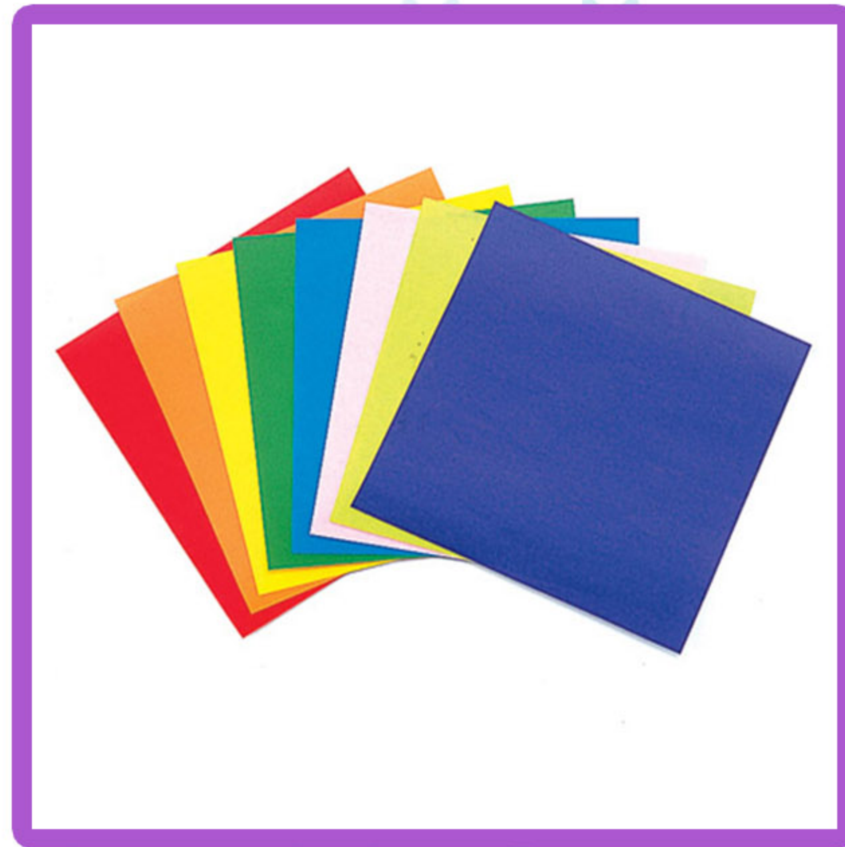
Папир у боји